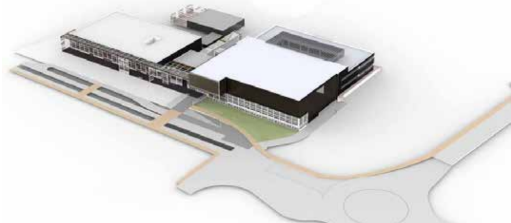
I rendering del polo delle secondarie

ramento della bolletta energetica: l'intero plesso sarà infatti oggetto di lavori per la riqualificazione energetica ed antisismica che porterà in classificazione Nzeb la scuola (sia per l'edificio esistente che per quello nuovo). Grazie all'abbattimento dei consumi energetici, saranno risparmiate 218 tonnellate di CO2 ogni anno: fotovoltaico, geotermia, isolamenti, facciate ventilate le soluzioni previste. ■